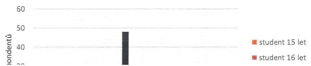
Tabulka č. 2: Přehled odpovědí respondentů na otázku č. 5.