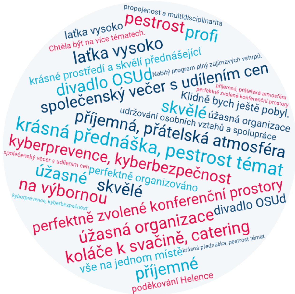
Obrázek 1 Nejčastěji uvedená slovní spojení ve zpětnovazebním dotazníku