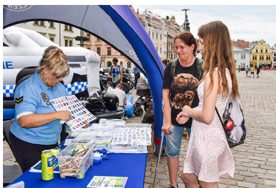
Evropský den proti vloupání v Plzni

V minulém roce díky spolupráci Policie ČR s Ministerstvem vnitra vznikla i čtyři preventivní videa, která pojednávají o kvalitním zabezpečení domácnosti a radí, jak vhodně ochránit domov před odjezdem na dovolenou, jak vzbudit dojem obydlené domácnosti, když nejste doma, a jaká základní pravidla dodržovat v případě vloupání. Video jsou dostupná ke zhlédnutí na oficiálním YouTube kanálu Policie ČR. Další informace a materiály jak chránit svůj majetek pak naleznete na webových stránkách eucpn.org , stopvloupani.cz nebo na policie.cz/zabezpectese . ■